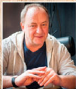
ЯНУШ ЛЕОН ВИШНЕВСКИЙ: МОИ «ОРГАЗМ» И «ЛАКШЕРИ»