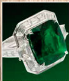
BELLDUC: ПРЕКРАСНАЯ ГЕРЦОГИНЯ