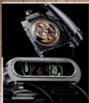
MB&F. ЧАСЫ НМ5. ЗВУКОВОЙ БАРЬЕР ПРЕОДОЛЕН