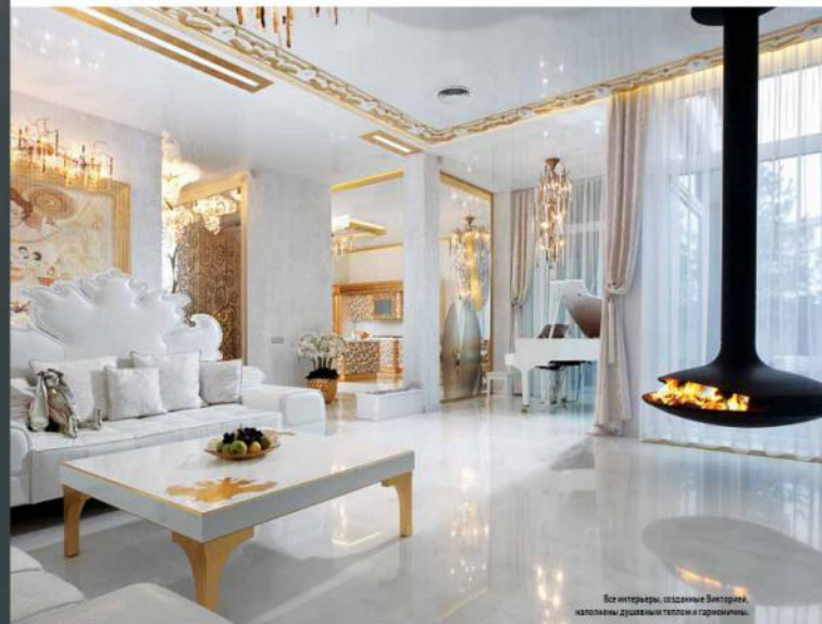
Во всех интерьерах, созданных Викторией, заложены душевный теплоты и гармоничности.

Что, на ваш взгляд, сегодня больше пользуется популярностью на интерьерном рынке?