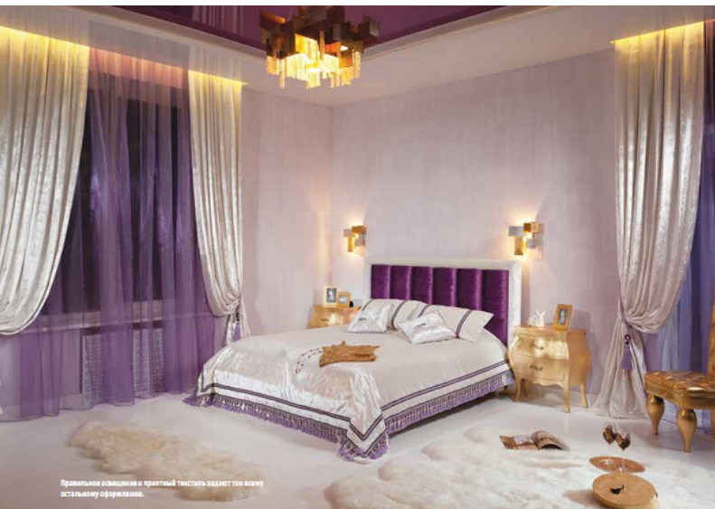
Правильное освещение и приятный тактиль делают эту комнату стильным помещением.

убивают полет творчества. Потому я всегда стараюсь развиваться в интересующих меня областях. Сейчас я как раз закончила работу над проектом, который очень меня радует и который я давно хотела создать, — нашим новым офисом. Некоторые дизайнеры любят работать с камнем, некоторые — с деревом или тканью... А какой ваш любимый материал? Почему? Все материалы хороши, но особенно я люблю работать с деревом и другими органическими поверхностями. Они способны создать иллюзию простора и обилия воздуха, расширить комнату, поднять потолки — дают ощущение свободы. Все это придает интерьеру легкость и роскошь. Какой из уже реализованных вами проектов вы цените больше всего? Я люблю все свои реализованные проекты. А самый ценный тот, над которым я тружусь именно в данный момент, потому что в него вкладываются все силы и энергии. Но когда работа над объектом закончена, начинается строительство другого — и уже он становится самым ценным. В каком архитектурном окружении (злаке, ошле) вы чувствуете себя комфортнее всего? В каждом стиле есть своя прелесть. Если рассматривать стили зрения работы, то я ориентируюсь и могу работать во всех стилях: нет каких-то лучше, а каких-то хуже. Что же касается