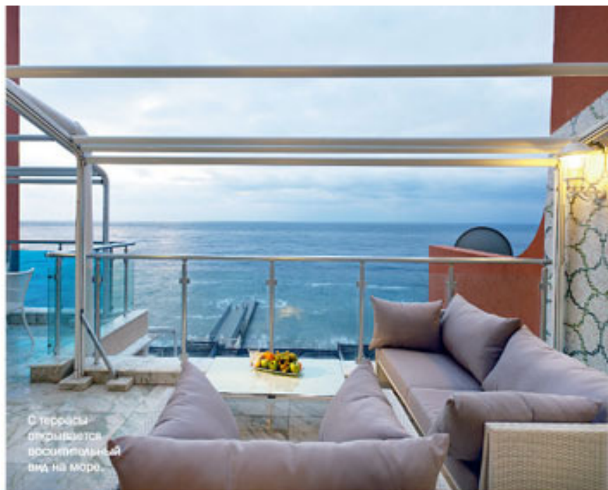
С террасы открывается великолепный вид на море.

статус и финансовое благополучие владельцев жилища. Понятно, что реализация такого интерьерного сценария требует значительных денежных затрат. Однако это вовсе не значит, что нужно обставлять квартиру исключительно брендовой мебелью, которая стоит десятки, а то и сотни тысяч евро. Так, кухня от итальянской фабрики – пример достаточно бюджетного варианта. Сама по себе она выглядит не очень дорого, но в комбинации с мрамором, камнем, серебряными цоколями, изящной подсветкой смотрится богато и изысканно.