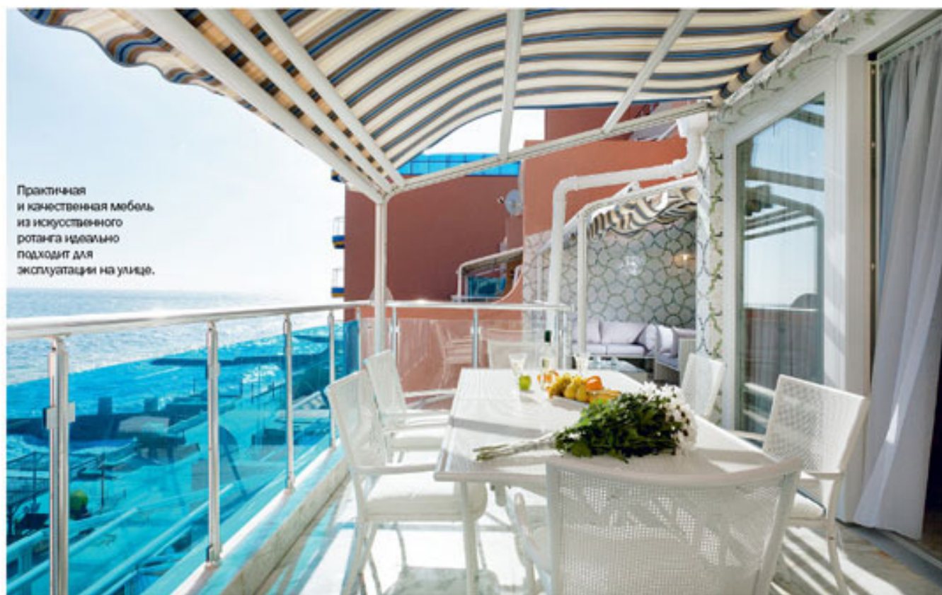
Практичная и качественная мебель из искусственного ротанга идеально подходит для эксплуатации на улице.

Напротив кровати установили зеркальную стену, визуально увеличившую объем помещения. Между прочим, зеркальная стена и зеркальная плитка – весьма сложные инструменты для работы с интерьером. Неправильное использование подобных конструкций чревато тем, что объем комнаты не >