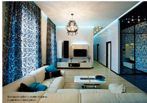
Виктория любит и умеет играть с цветами и фактурами.