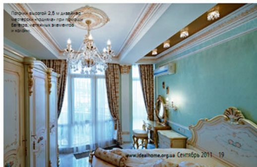
Панорамный обзор 2,5 м дизайнерского потолка «поднял» при помощи белоснежных аксессуаров и тканей.