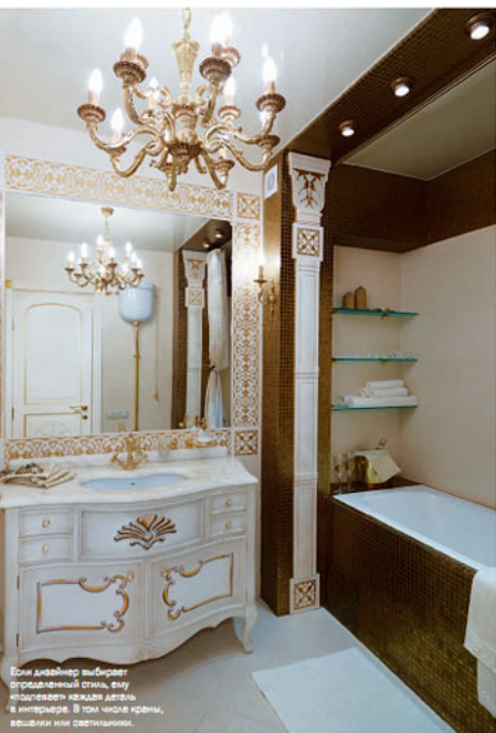
Сам дизайнер выбирает определенный стиль, ему нравится как-то делить и интерьеры. В тои числе краски, вешалки или светильники.