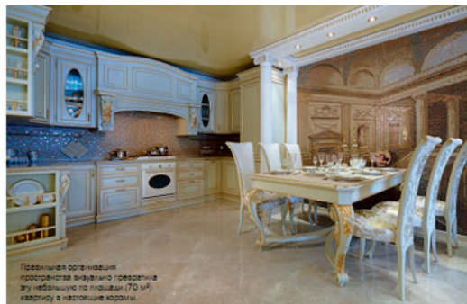
Привлекательное пространство органично превращает эту небольшую по площади (70 м²) квартиру в настоящие хоромы.

Очень. Но из-за работы покинуть по миру удается не очень часто. Кстати, это мое первое лето без отпуска (улыбается).