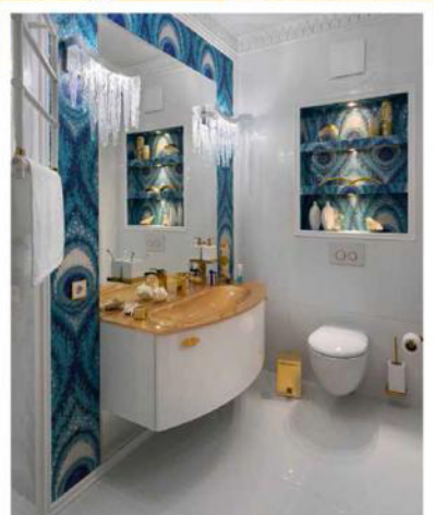
Широкие бирюзовые-синие мозаичные полосы на стене стали акцентированной рамой для зеркала. Неизбежно выложена мозаикой.