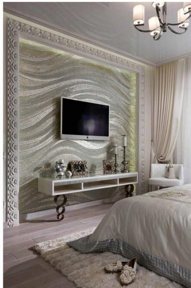
Волны белоснежной мозаики, заволакующей торшеры, стену спальни, подчеркивают податливой и широким г-образным багетом с обильными фактурными орнаментами.