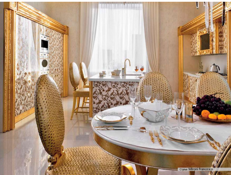
Стулья Mironi Francesco

Зеркальные фасады с пескоструйным орнаментом визуально расширяют пространство холла