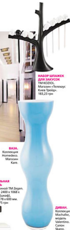
ВАЗА. Коллекция HomeDeco. Магазин Kage.

P.S. слагаемые стиля и комфорта в гостиной