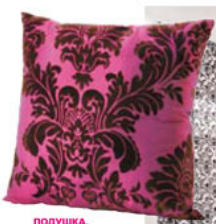
ПОДУШКА. Коллекция HomeTex. Магазин Kage.