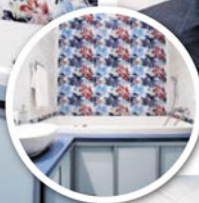
ВАННАЯ КОМНАТА. Синие-белая палитра помещения выбрана неслучайно. Белый – цвет чистоты, синий – цвет умиротворения и расслабления. Мебель в этой цветовой гамме выполнена по размерам комнаты и в соответствии с выбранной стилистикой.