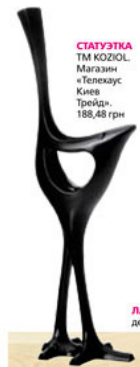
СТАТУЭТКА ТМ KOZIOL. Магазин «Телехаус Киев Трейд». 188,48 грн