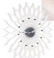
НАСТЕННЫЕ ЧАСЫ. Коллекция Tick Tack. Магазин Kage.