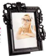
РАМКА ДЛЯ ФОТО. Коллекция HomeDeco. Магазин Kage.